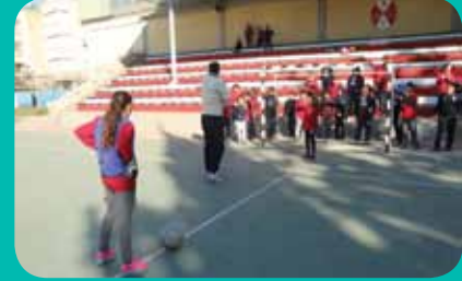
Tarsus SEV Ortaokulu Mersin Şampiyonu oldu.